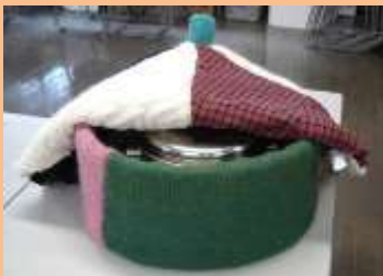
保温調理器作り（見本）